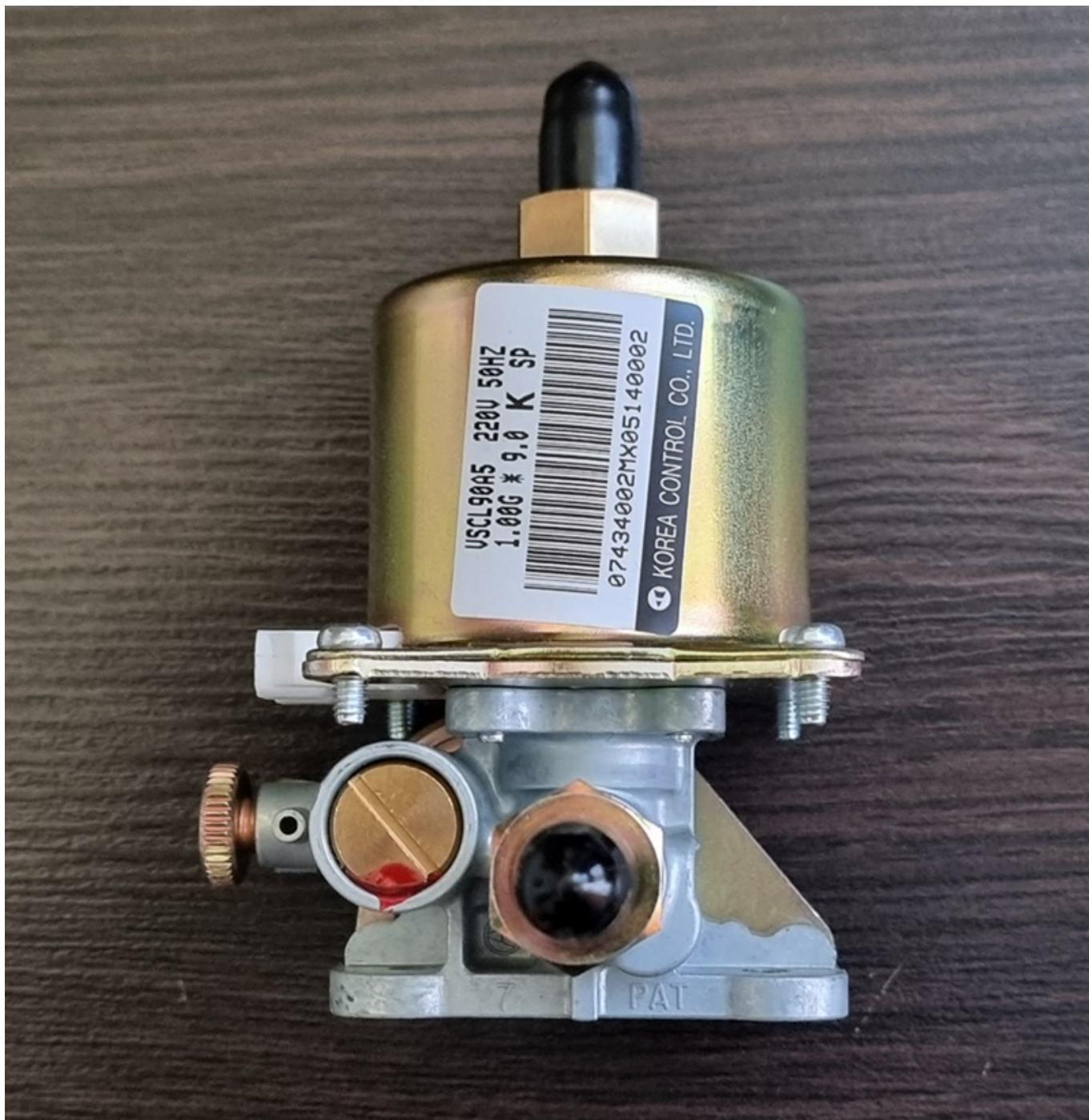
PARAMETRY TECHNICZNE POMPY OLEJOWEJ VSC-36, VSC-63 i VSC-90